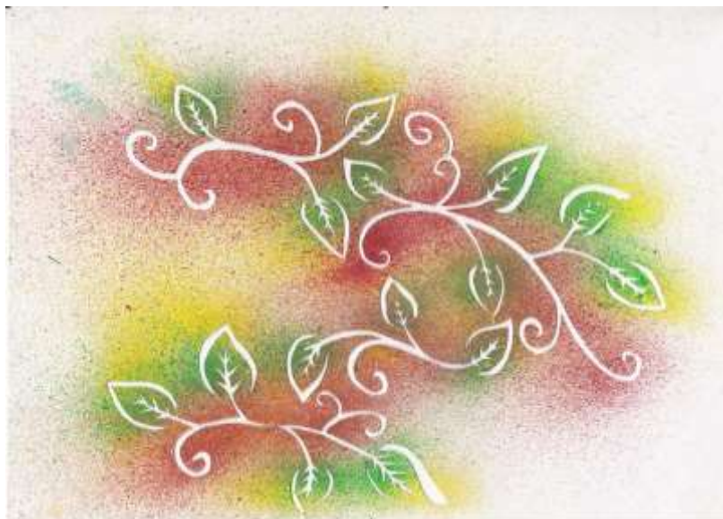
Šablona pre bodypainting s jesennou tematikou, autorka